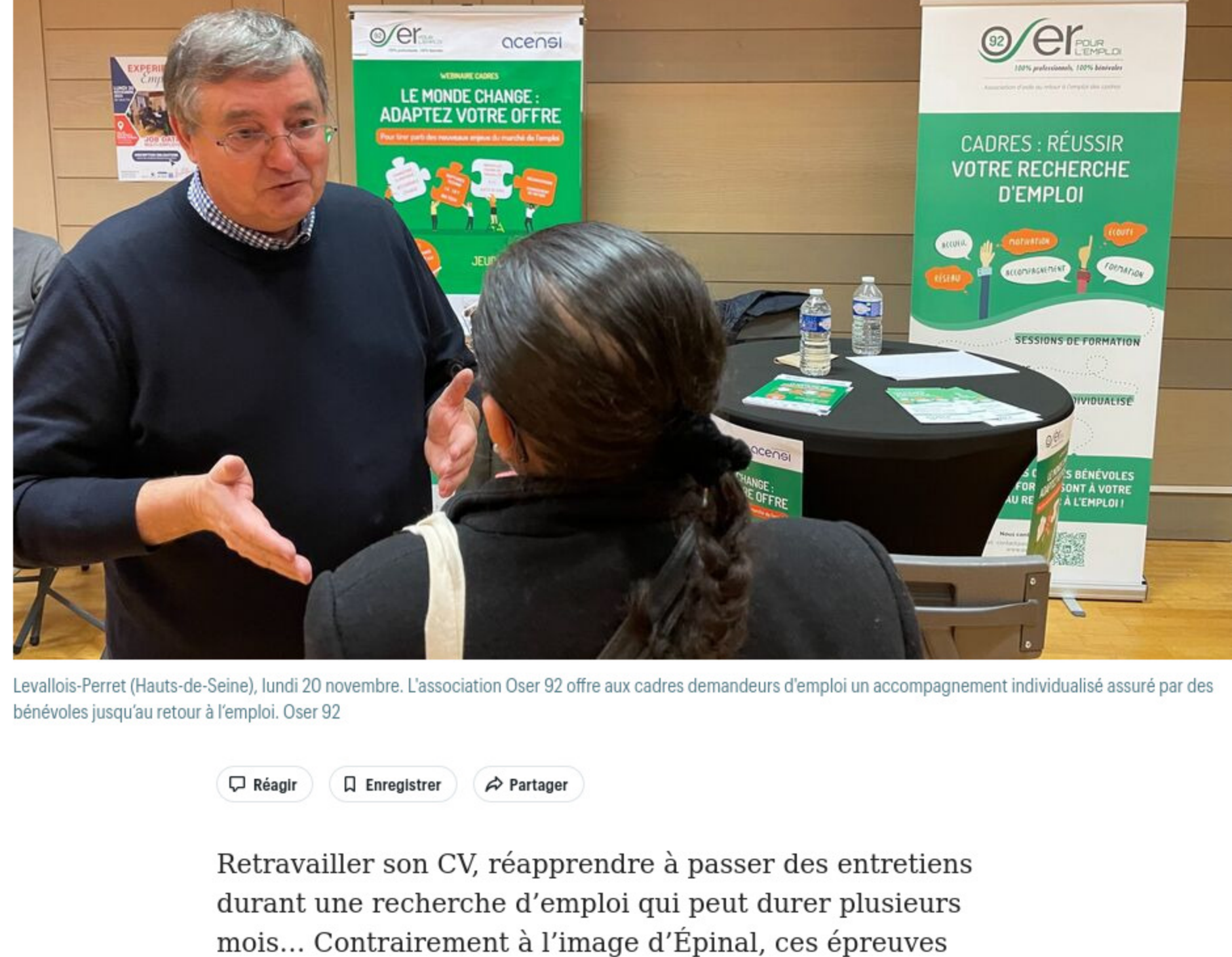
Levallois-Perret (Hauts-de-Seine), lundi 20 novembre. L'association Oser 92 offre aux cadres demandeurs d'emploi un accompagnement individualisé assuré par des bénévoles jusqu'au retour à l'emploi. Oser 92

Par Hendrik Delaine Le 13 décembre 2023 à 08h02