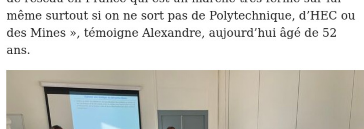
Saint-Cloud, mardi 17 novembre 2023. Les cadres accompagnés par l'association Oser 92 suivent une formation en groupe de deux semaines pour conforter les bases de la recherche d'emploi efficace, avec des bénévoles qui sont d'anciens cadres supérieurs. Oser 92